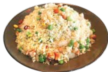
Salted Fish & Chicken Fried Rice CƠM CHIÊN CÁ MẶN