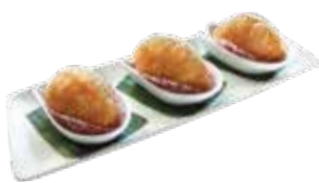
Fried Savory Dumpling with Fresh Prawn BÁNH NẾP TÔM