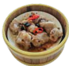
Steamed Pork Ribs with Black Bean Sauce SƯỜN HEO HẤP SỐT TƯƠNG ĐEN