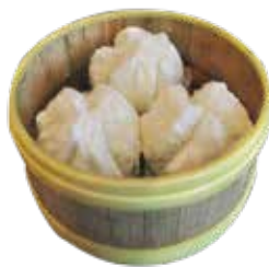
Barbecued Pork Bun BÁNH BAO THỊT HEO XÁ XÍU