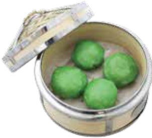
Scallop & Minced Pork with Shrimp Dumpling CỎ HẢI SẢN VÀ THỊT HEO