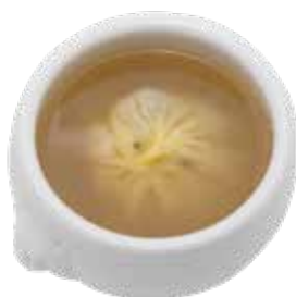
Crab Meat Dumpling Soup SÚI CỎ THỊT GHẸ