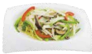
"Hong Kong" Style Vegetable Noodles MÌ XÀO RAU KIỂU HỒNG KÔNG