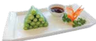
Crunchy Okra with Szechuan Spicy Sauce ĐẬU BẮP LUỘC VỚI SỐT ỚT TỨ XUYÊN