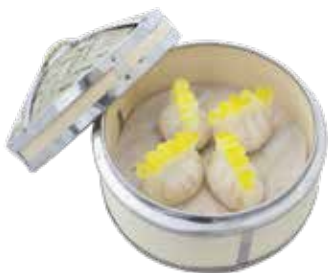
Fresh Mushroom Dumpling CẢO NẤM