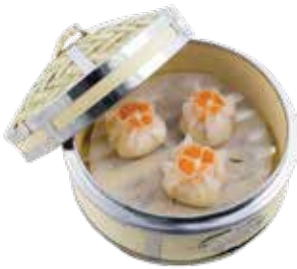
Japanese Bay Scallop Dumpling with XO Shrimp Roe CỎ SÒ ĐIỆP NHẬT SỐT XO & TRỨNG TÔM