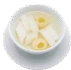
Chilled Almond Jelly with Longan CHÈ HẠNH NHÂN VÀ NHẪN