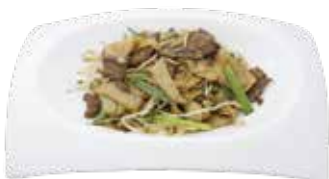
Fried Rice Noodles with Sliced Beef MÌ XÀO BÒ