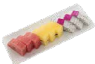
Seasonal Tropical Fresh Fruits TRÁI CÂY