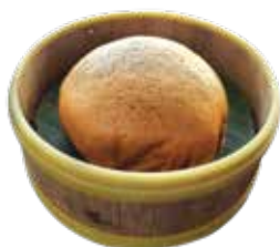
Steamed Sponge Cake BÁNH MẪ LAI