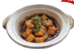
Stewed Tofu with Salted Fish ĐẬU PHỤ OM CÁ MẶN