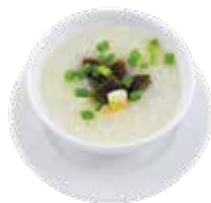
Preserved Century Egg & Meat Congee CHÁO THỊT VÀ TRỨNG BÁCH THẢO