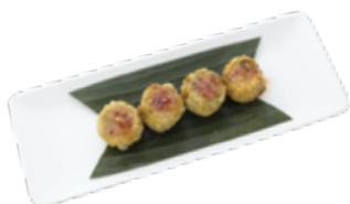
"Thai" Style Siew Mai XÍU MẠI KIỂU THÁI LAN