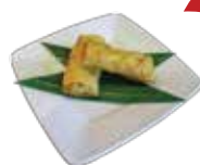
Deep-Fried Bean Curd Sheet with Prawn Paste PHÙ TRÚC CỤỘN CHIÊN