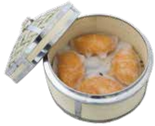
Red Caviar & Crab Meat Dumpling, Japanese Shrimp Roe CỎ THỊT GHỆ TRỨNG TÔM NHẬT BẢN