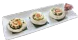
Pan Fried Mini Vegetable Pork Bun With Scallion BÁNH BAO HÀNH