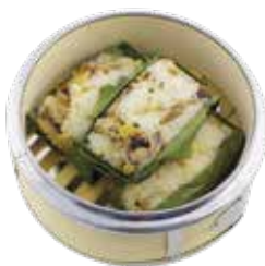
Glutinous Rice Chicken in "La Dong" Leaves XÔI GÀ