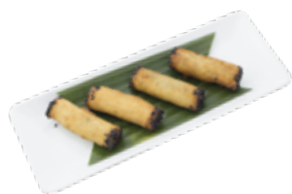
Golden Dragon Spring Roll CHẢ RAM RỒNG VÀNG