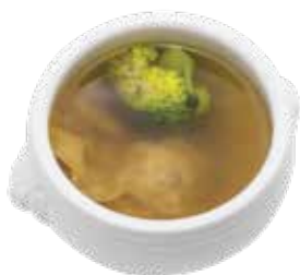
"Shanghai" Wonton Soup SÚP HOÀNH THÁNH THƯỢNG HẢI