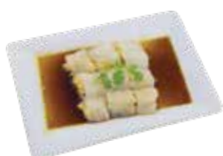
Steamed Rice Roll with Fresh Prawn BÁNH CUỐN NHÂN TÔM