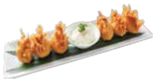
Deep Fried Shrimp Wonton HOÀNH THÁNH TÔM CHIÊN GIÒN