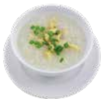
Special Golden Dragon Sliced Fish Congee CHÁO CÁ ĐẶC BIỆT