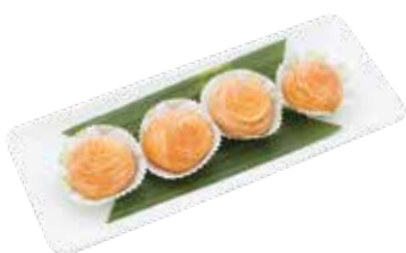
Deep Fried Durian Puff BÁNH RÁN SẦU RIÊNG