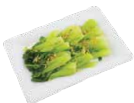
Stir Fried Bok Choy CẢI THÌA XÀO