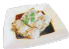
Steamed Rice Roll with Minced Beef BÁNH CUỐN NHÂN BÒ BẦM