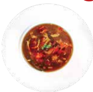
Hot & Sour Seafood Soup SÚP HẢI SẢN CHUA CAY