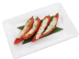
Minced Squid & Shrimp Stuffed in Red Chili MỰC VÀ TÔM XAY NHỎ ỚT CHIÊN