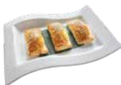
BBQ Pork Puff Pastry BBQ XÁ XÍU