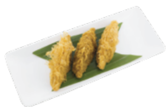
Deep Fried Yam Dumpling CỎ KHOAI MÔN