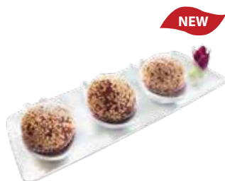
Deep Fried Purple Sweet Potato Balls BÁNH RÁN KHOAI LANG TÍM