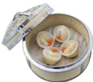
Snail & Clam Dumpling with Hoi Sin Cilantro Turmeric CẢO NGHÊU