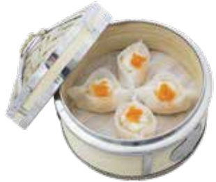
Scallop Dumpling with Garlic CỎ SÒ ĐIỆP VỚI TỎI