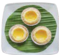
Egg Custard Tart BÁNH TRỨNG NƯỚNG