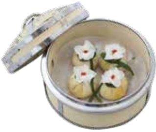
Norwegian Salmon Fillet, Superior Prawn Curry Dumpling CỎ CÁ HỒI - TÔM