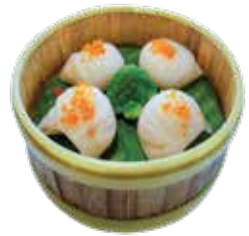
"Har Kau" Shrimp Dumpling HÁ CỎ TÔM