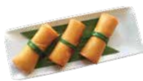
Shrimp & Taro Spring Rolls CHẢ GIÒ TÔM KHOAI MÔN