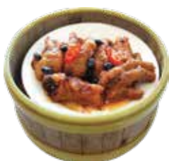
Chicken Feet with Black Bean Sauce CHÂN GÀ SỐT TƯƠNG ĐEN