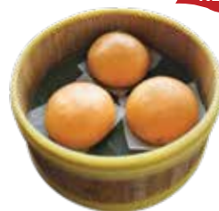
Custard Bun KIM SA BAO

All our prices are exclusive 10% VAT & 5% service charge Giá trên chưa bao gồm 10% thuế VAT và 5% phí phục vụ