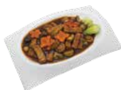
Braised Bean Curd with Mushroom ĐẬU HŨ OM NẤM