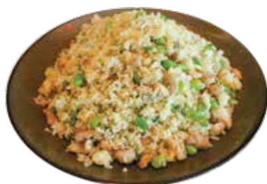
Scallop Fried Rice CƠM CHIÊN SÒ ĐIỆP