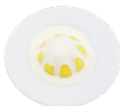
Mango Pudding THẠCH XOÀI