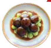
Braised Black Mushroom with Bok Choy in Oyster Sauce CẢI THÌA XÀO NẤM SỐT DẦU HÀO