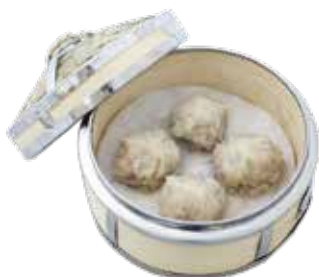
"Shanghai" Style Minced Pork Dumpling CẢO THỊT HEO