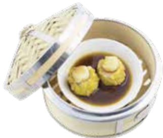
"Siew Mai" Minced Pork with Shrimp & Abalone Sauce "XIU MAI" TÔM THỊT SỐT BÀO NGŨ